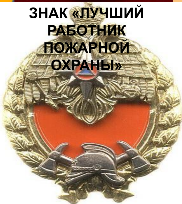
ЗНАК «ЛУЧШИЙ РАБОТНИК ПОЖАРНОЙ ОХРАНЫ»