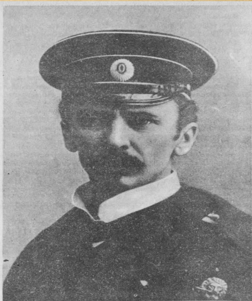
Петр Петрович Шмидт — командующий революционным флотом, поднявший флаг на крейсере „Очаков”.

„Тот, кому дана способность страдать за других и логически мыслить, кто пристально изучал общественные науки, тот — убежденный социалист”, — писал П. П. Шмидт в октябре 1905 г.