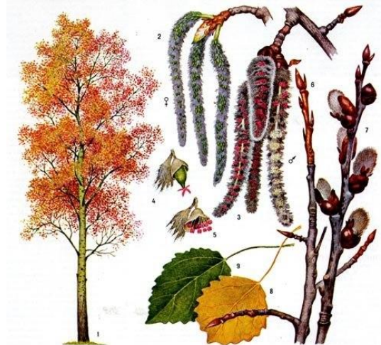
си О на