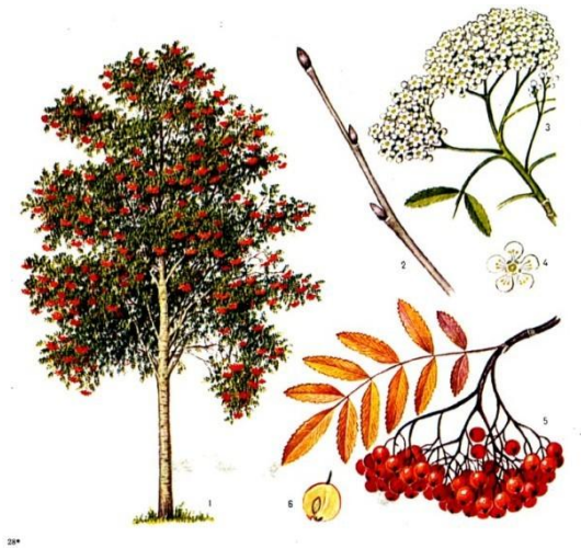
би на Ря