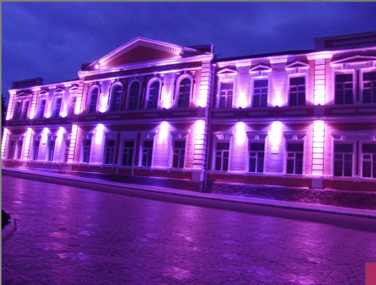
ЗДАНИЕ МУНИЦИПАЛЬНОЙ ГИМНАЗИИ - ПАМЯТНИК ИСТОРИИ И АРХИТЕКТУРЫ, 1908 ГОД