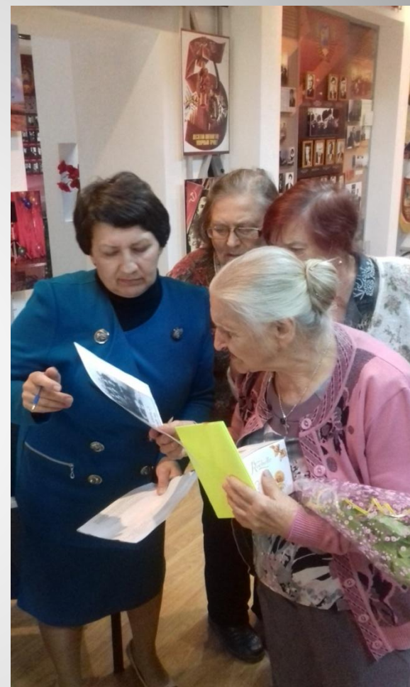
Фото из архива музея вызвало оживлённый разговор и всколыхнуло память педагогов-ветеранов.