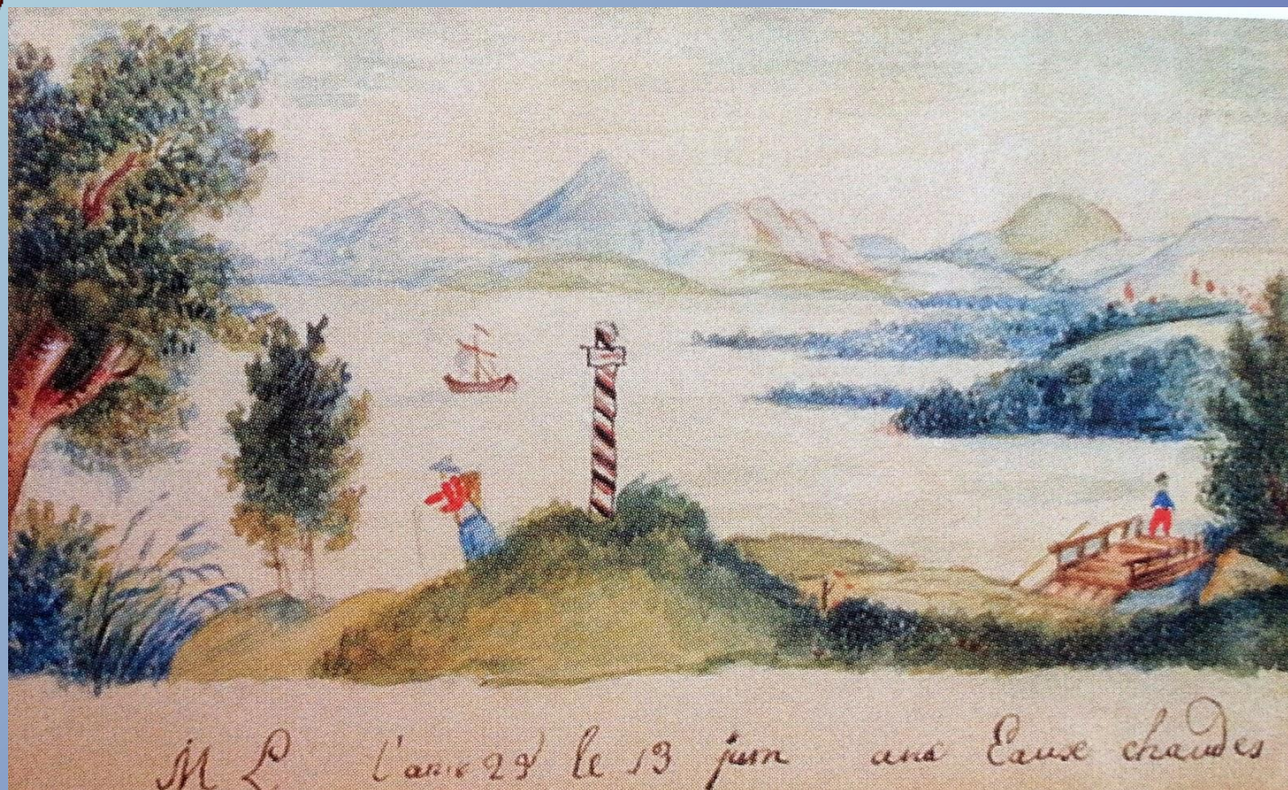
Акварель М.Ю. Лермонтова «На горячих водах», 1825 г.