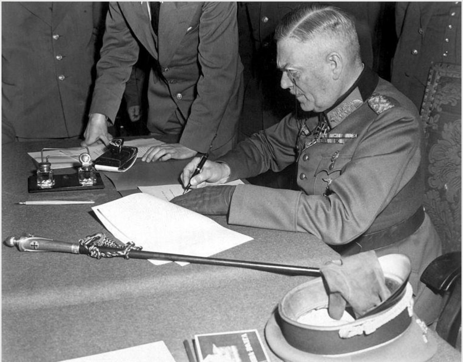
Вильгельм Кейтель подписывает Акт о безоговорочной капитуляции Германии.