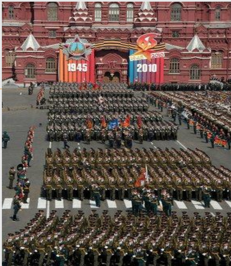
День Победы на Красной площади.