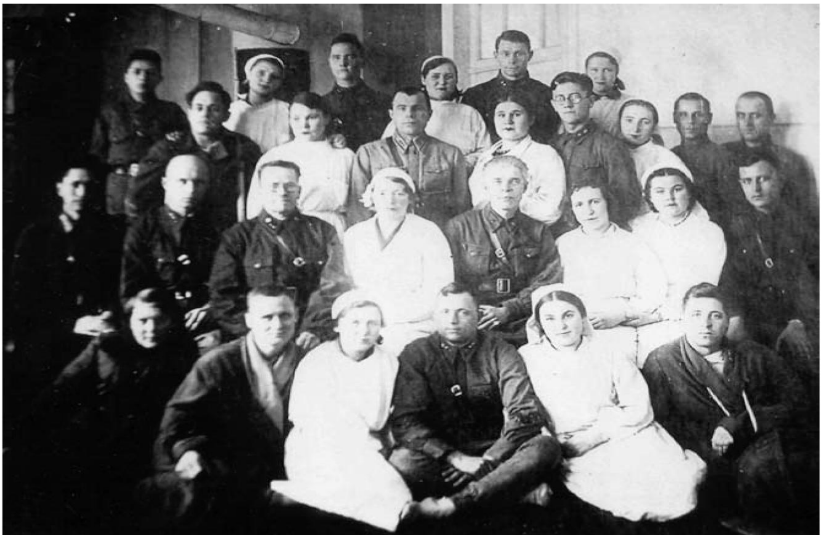
Сотрудники военного госпиталя на базе Липецкого курорта. 1943 год