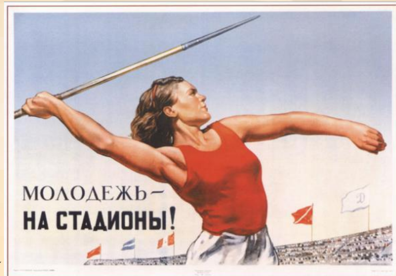
504. Голованов Л. Молодежь — на стадионы! 1947