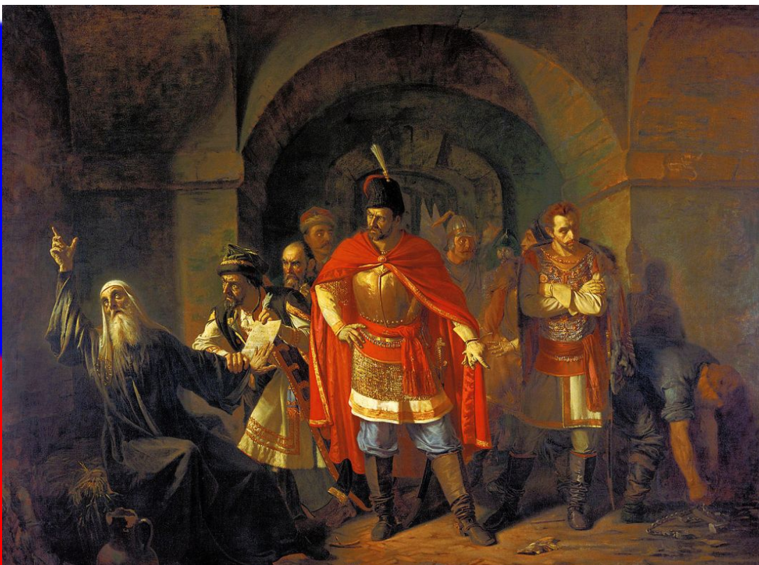
Павел Чистяков — «Патриарх Гермоген в темнице отказывается подписать грамоту поляков», 1860

Уже в январе 1611 против захватчиков начал вооружаться народ в Казани, Вятке. По всей стране пересылались письма патриотов с призывом очистить Москву от «литовских людей» и выбрать русского царя. Призыв был поддержан и патриархом Гермогеном.