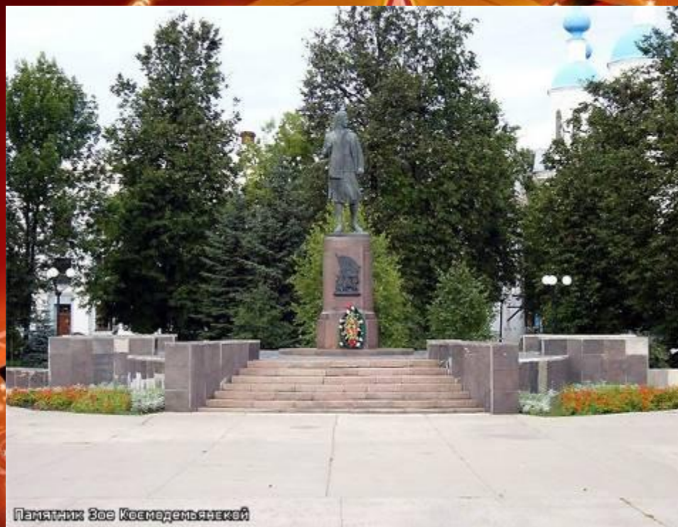
Памятник Зое Космодемьянской в г. Тамбове