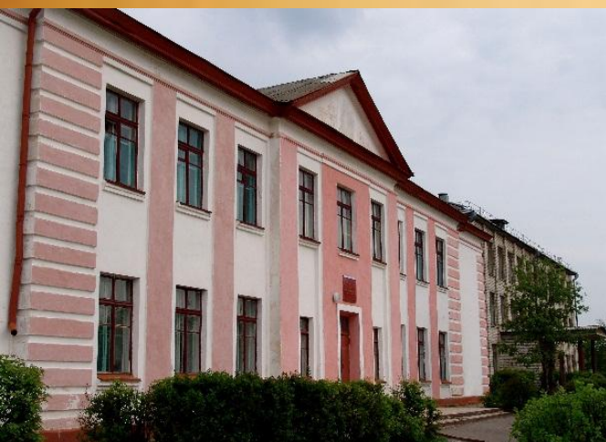
МБОУ СОШ №56