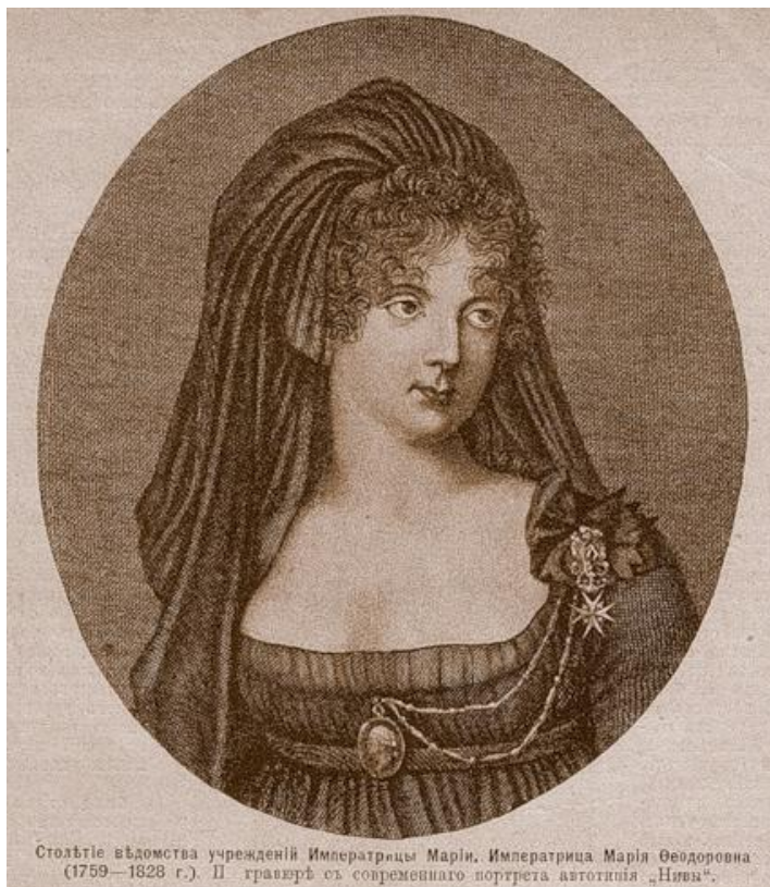
Столітє вѣдомства учрежденій Императрицы Маріи. Императрица Марія Феодоровна (1759—1828 г.). П. гравіръ съ соременнаго портрета автотипія „Нива“.

В 1814 году по распоряжению императрицы Марии Федоровны из Петербургского “вдовьего дома” на добровольных началах были приглашены и направлены в больницу женщины для “прямого назначения” ходить и смотреть за больными.