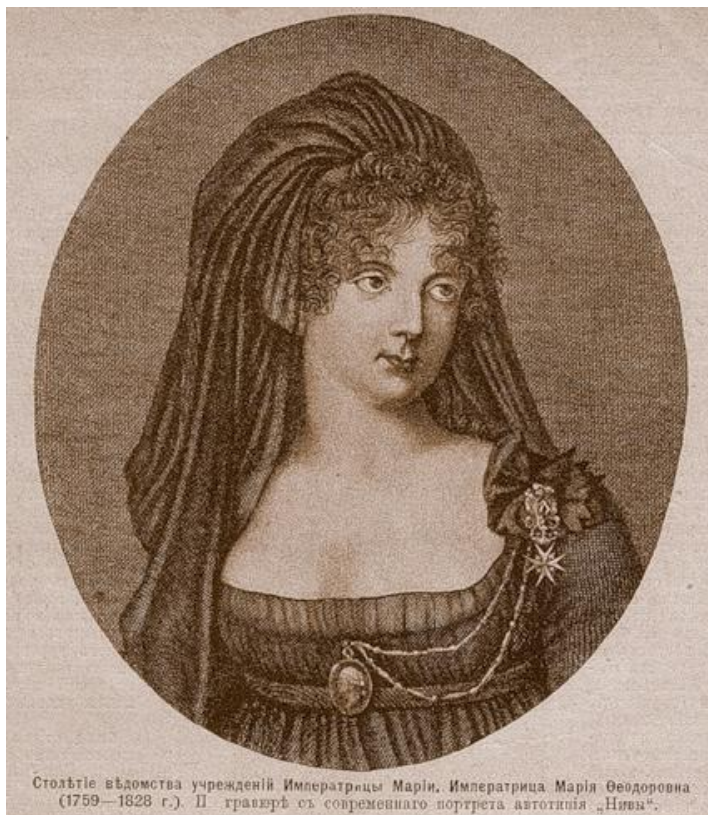
Столітє вѣдомства учрежденій Императрицы Маріи. Императрица Марія Федоровна (1759—1828 г.). П. гравіръ съ соременнаго портрета автотипія „Нива“.

В 1814 году по распоряжению императрицы Марии Федоровны из Петербургского “ вдовъего дома” на добровольных началах были приглашены и направлены в больницу женщины для “прямого назначения” ходить и смотреть за больными.