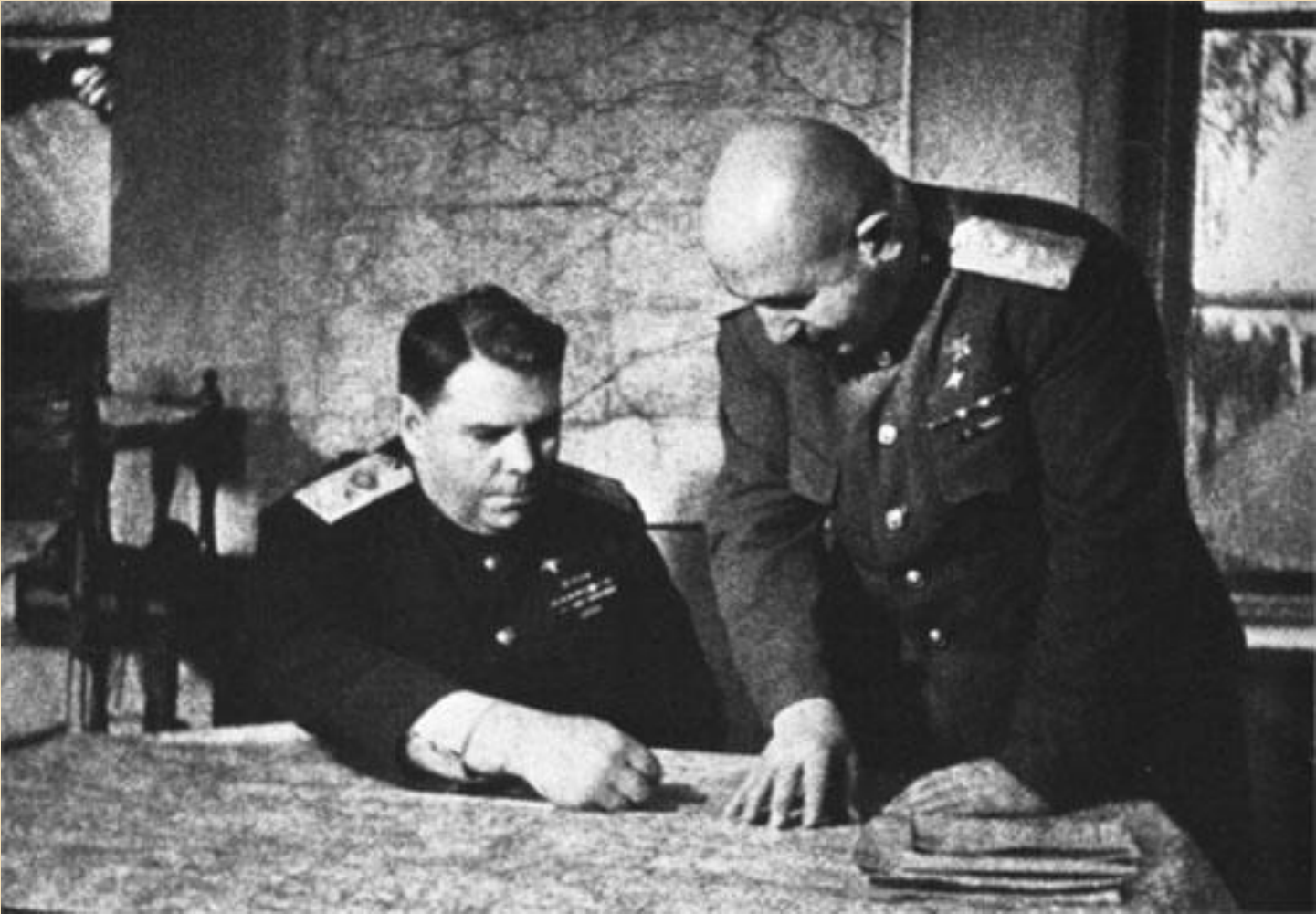
Командующий 3-м Белорусским фронтом Маршал Советского Союза А. М. Василевский и его заместитель генерал армии И. Х. Баграмян уточняют план штурма Кенигсберга