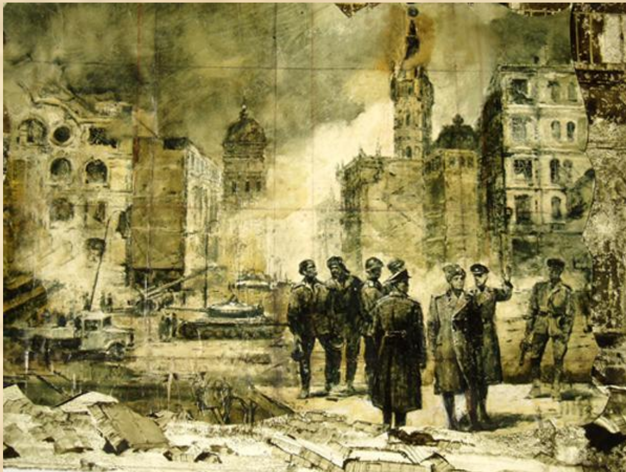
После штурма Кенигсберга.