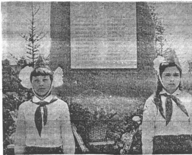
Почетный караул у обелиска.