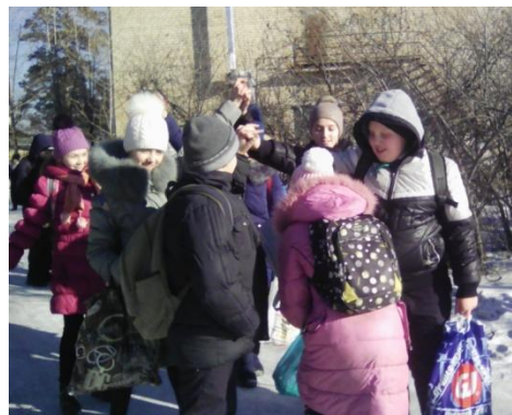
Отряд «ЗВЁЗДЫ» на перемене.