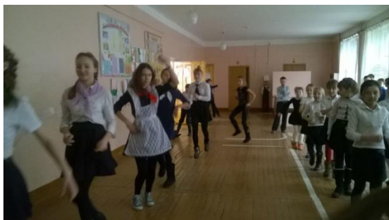
Волонтерские отряды «Дружба» и «Звездопад» с флешмобом «Делай, как Я! Делай, как Мы!, Делай лучше нас!»