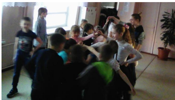
Отряд «Юность» в начальной школе.