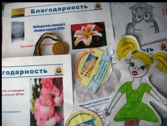
Участники конкурса «Ученик класса 2010 »

Широкими возможностями выявления и развития одаренных учащихся обладают различные факультативы, кружки, конкурсы, интеллектуальный марафон, участие в олимпиадах и конкурсах вне школы и система исследовательской работы учащихся.