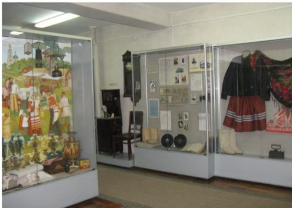
Фрагмент экспозиции «Михайловка: из века в век»

Экспозиция включает в себя предметы, рассказывающие о бытии края, о его жителях, о революционных событиях и временах Великой Отечественной войны.