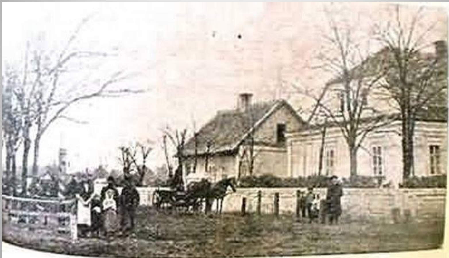
Heidenfeld. — Doktorhaus mit Konsultationsgebäude.

В это же время появилась и больница, где работал всего один врач.