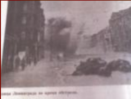
Улица Ленинграда во время обстрела