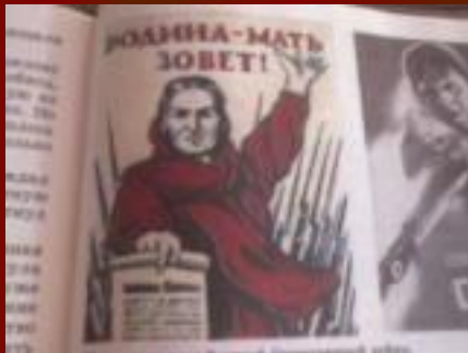
Плакаты времен Великой Отечественной войны