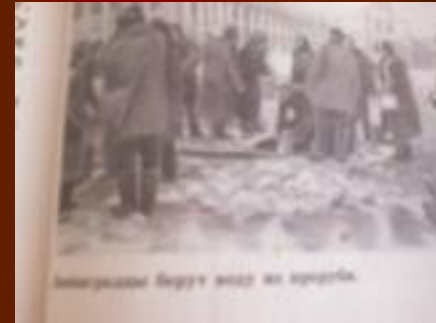
Ленинградцы берут воду из проруби