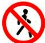
3.10 Проход закрыт