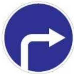
4.1.2 Движение направо