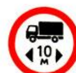
3.15 Ограничение длины