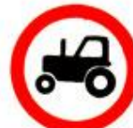
3.6 Движение тракторов запрещено