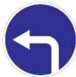
4.1.3 Движение налево