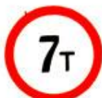
3.11 Ограничение массы