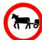
3.8 Движение гужевых повозок запрещено