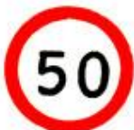
3.24 Ограничение максимальной скорости