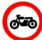
3.5 Движение мотоциклов запрещено