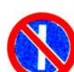
3.29 Стоянка запрещена по нечетным числам