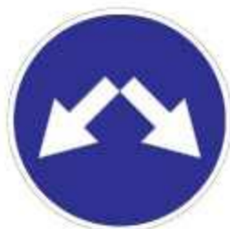
4.2.3 Объезд препятствия справа или слева