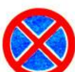
3.27 Остановка запрещена