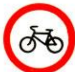
3.9 Движение на велосипедах запрещено