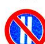
3.30 Стоянка запрещена по четным числам