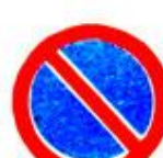
3.28 Стоянка запрещена