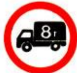
3.4 Движение грузовых автомобилей запрещено