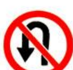
3.19 Разворот запрещен