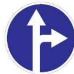
4.1.4 Движение прямо или направо