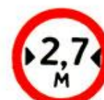
3.14 Ограничение ширины