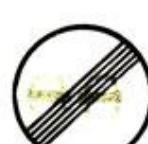
3.21 Конец зоны запрещения обгона