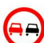
3.20 Обгон запрещен