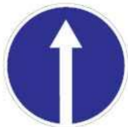
4.1.1 Движение прямо