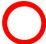
3.2 Движение запрещено