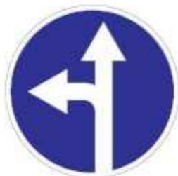
4.1.5 Движение прямо или налево