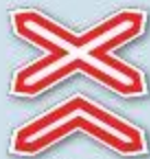
1.3.2 Многопутная железная дорога