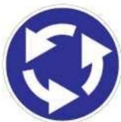
4.3 Круговое движение