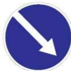
4.2.1 Объезд препятствия справа