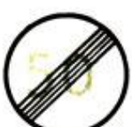
3.25 Конец зоны ограничения максимальной скорости