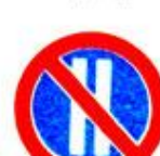
3.30 Стоянка запрещена по четным числам