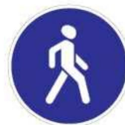
4.5 Пешеходная дорожка