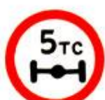
3.12 Ограничение нагрузки на ось