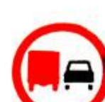
3.22 Обгон грузовым автомобилем запрещен