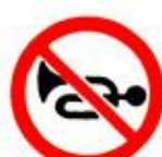
3.26 Подача звукового сигнала запрещена