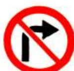
3.18.1 Поворот направо запрещен