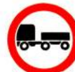
3.7 Движение с прицепом запрещено