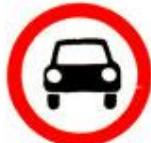
3.3 Движение механических транспортных средств запрещено