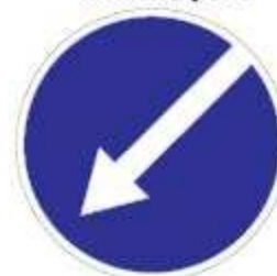
4.2.2 Объезд препятствия слева