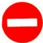
3.1 Въезд запрещен