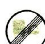
3.23 Конец зоны запрещения обгона грузовым автомобилем