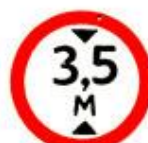
3.13 Ограничение высоты