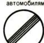
3.31 Конец зоны всех ограничений