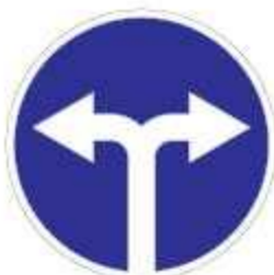
4.1.6 Движение направо или налево