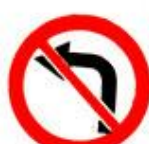
3.18.2 Поворот налево запрещен