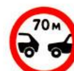
3.16 Ограничение минимальной дистанции