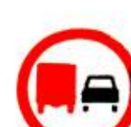
3.22 Обгон грузовым автомобилем запрещен