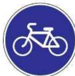
4.4 Велосипедная дорожка