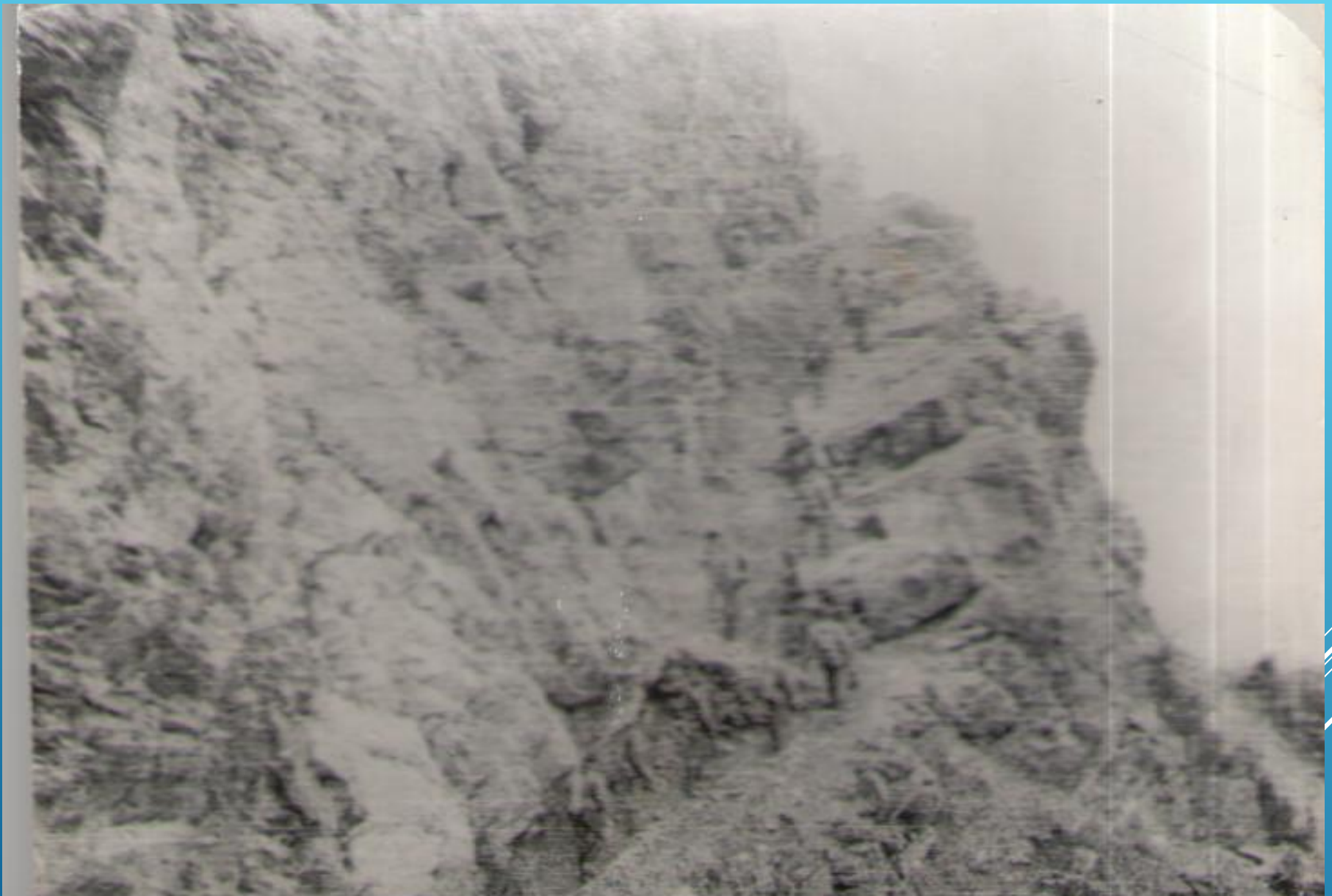
Ваханский коридор ( Афганистан 1983 год)