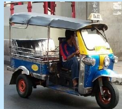
«Тук-тук»- городской транспорт в Бангкоке