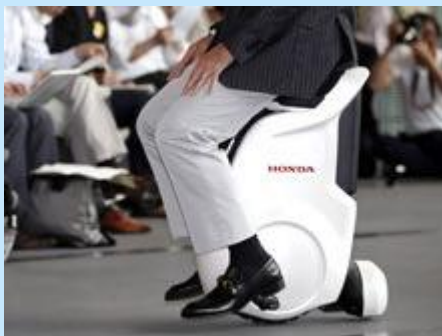
“офисный самокат” от компании Honda