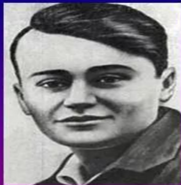
Олег Васильевич Кошевой