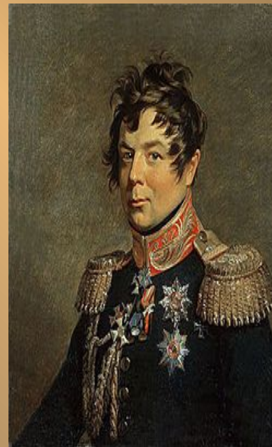
Генерал-фельдмаршал Иван Дибич- Забалканский.