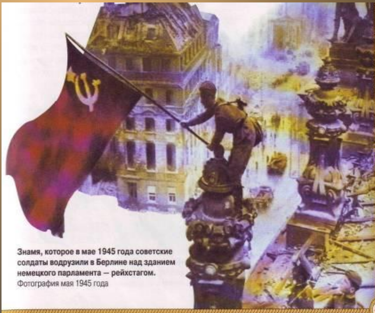
Знамя, которое в мае 1945 года советские солдаты водрузили в Берлине над зданием немецкого парламента — рейхстагом. Фотография мая 1945 года

Воины Александра Невского, дружинники Дмитрия Донского, солдаты Суворова и миллионы советских солдат шли в бой за Родину, за честь и свободу своей земли, и они ПОБЕДИЛИ!