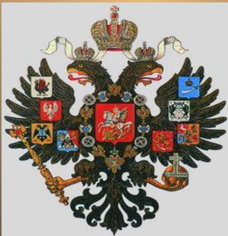
Герб Российской Империи

В центре двуглавого орла изображен Георгий Победоносец, пронзающий копьем змея.