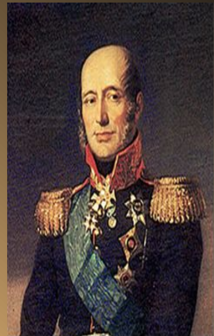
генерал-фельдмаршал граф Михаил Барклай-де- Толли