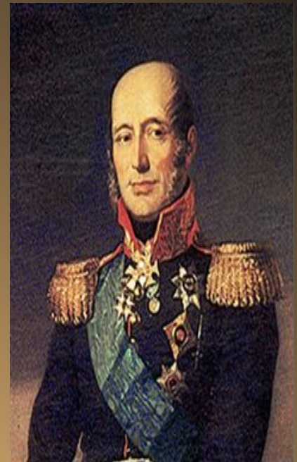
генерал-фельдмаршал граф Михаил Барклай-де- Толли