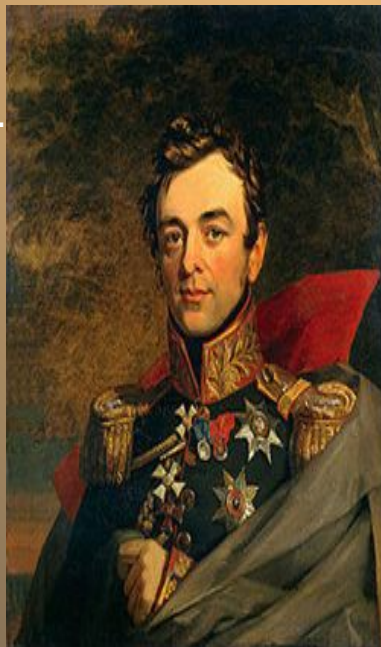
Генерал-фельдмаршал граф Иван Паскевич- Эриванский