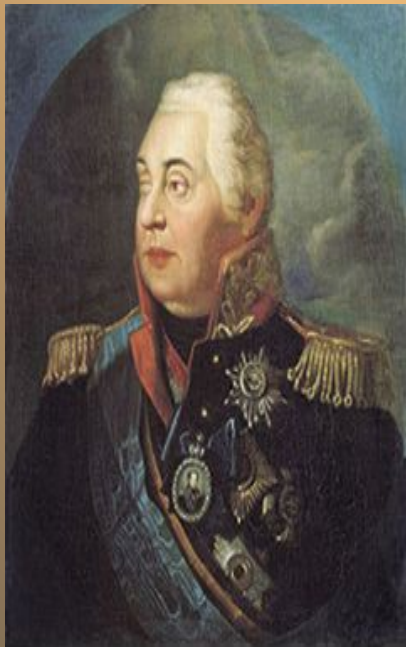
Фельдмаршал князь Михаил Кутузов - Смоленский

Полных Кавалеров было всего четыре – это были герои Отечественной войны 1812 года