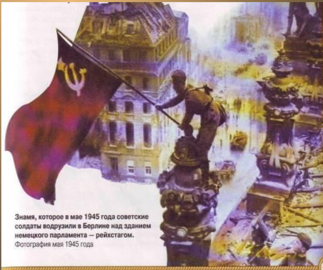
Знамя, которое в мае 1945 года советские солдаты водрузили в Берлине над зданием немецкого парламента — рейхстагом. Фотография мая 1945 года

Воины Александра Невского, дружинники Дмитрия Донского, солдаты Суворова и миллионы советских солдат шли в бой за Родину, за честь и свободу своей земли, и они ПОБЕДИЛИ!