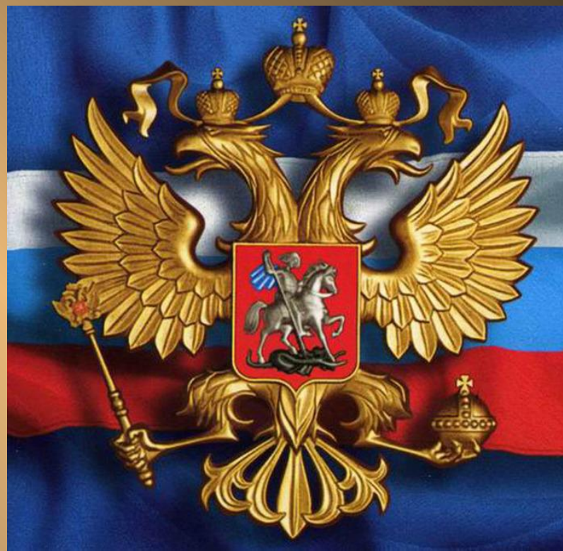
Герб Российской Федерации