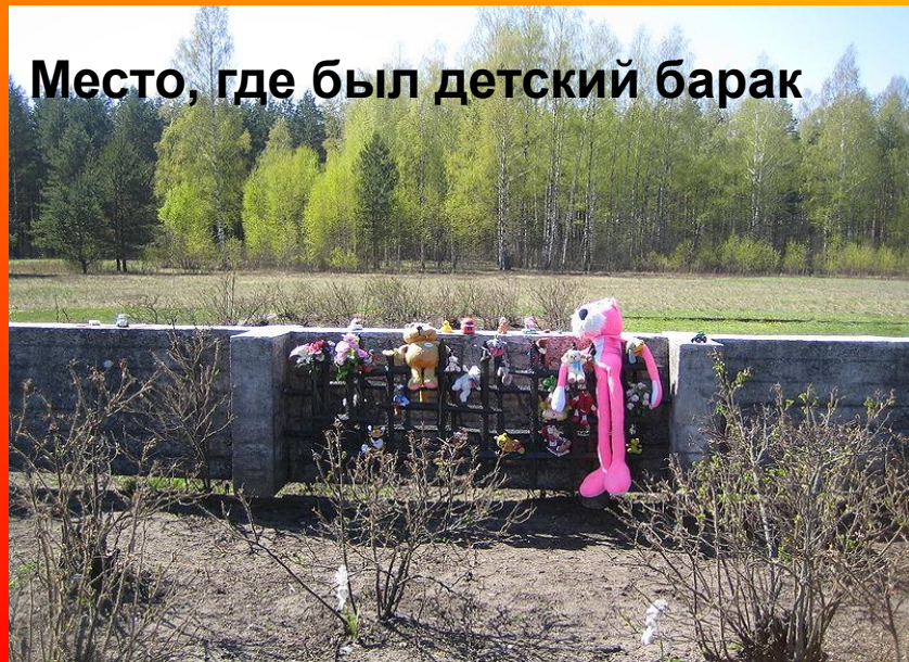
Место, где был детский барак

На территории мемориала много различных памятников и скульптур. Внизу находится небольшой музей.