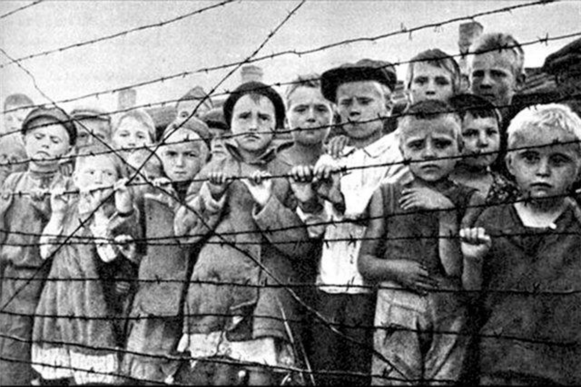
Особенно мрачная слава концлагеря связана с ужасным содержанием детей, которых здесь методично уничтожали.