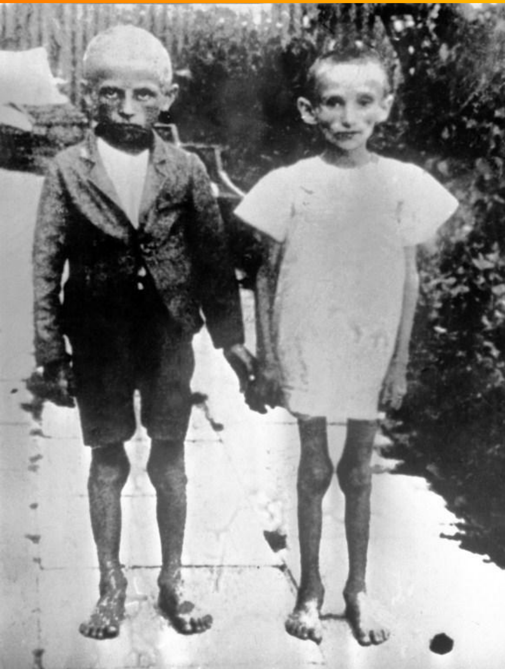
Дети из концлагеря Саласпилс.

Кроме мужчин в лагерь привозили стариков, детей и женщин. Жен разлучали с мужьями, женщин с детьми.