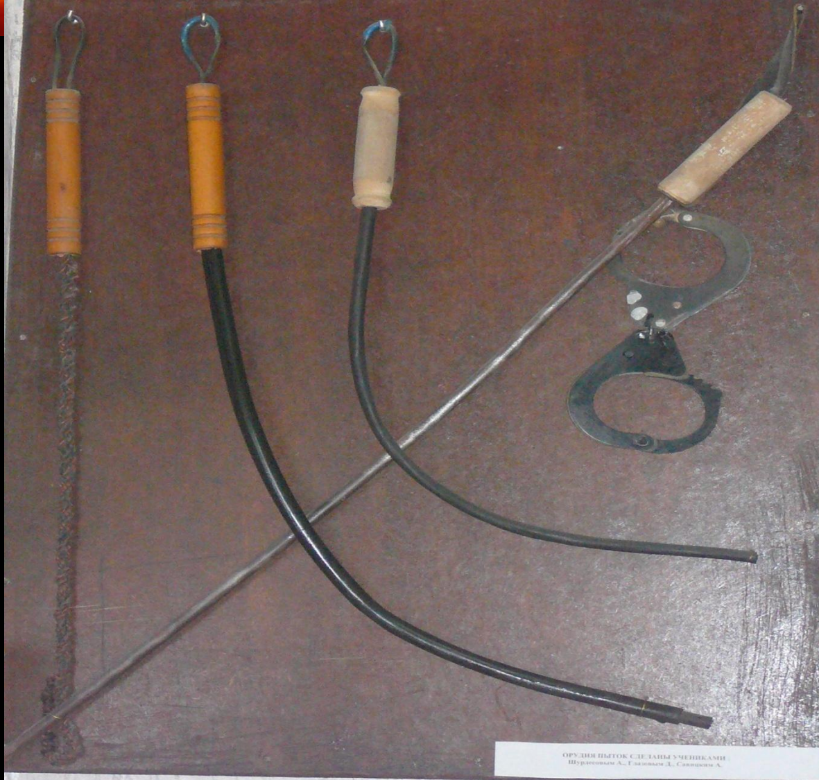
ОРУДИЯ ПЫТОК СДЕЛАНЫ УМЕТЦАМИ Шуратовский А., Глазковский Д., Соловьев А.