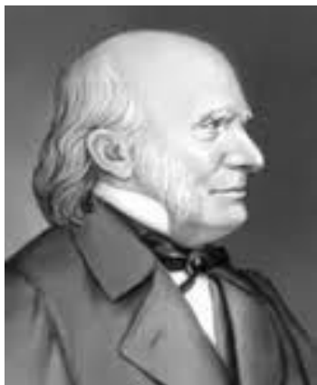
А. Дистервег, немецкий педагог-демократ XIX в., последователь Песталоцци