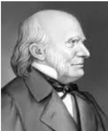
А. Дистервег, немецкий педагог-демократ XIX в., последователь Песталоцци