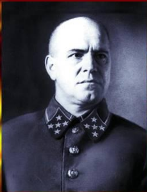
Георгий Константинович Жуков, командующий Западным фронтом, оборонявшим Москву