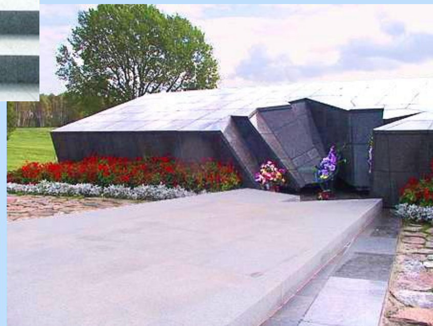
Памятник на месте сожженного сарая