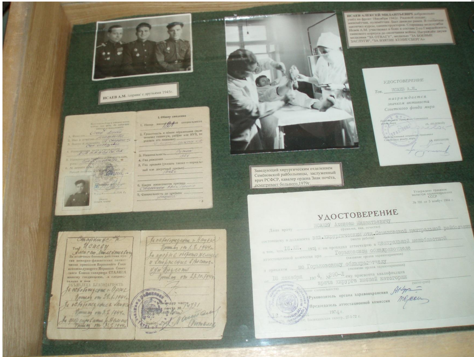
СТЕНД С ФОТОГРАФИЯМИ И ВЕЩАМИ ДЕДУШКИ В ВОЕННОМ ЗАЛЕ МУЗЕЯ.