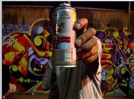
Баллон с аэрозольной краской, самый популярный граффити-инструмент