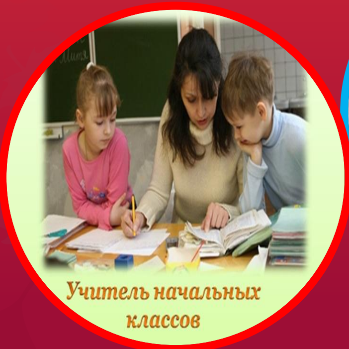
Учитель начальных классов

Учитель открывает ребенку огромный и необъятный окружающий мир. Дарит детям любовь, ласку, внимание и терпение.