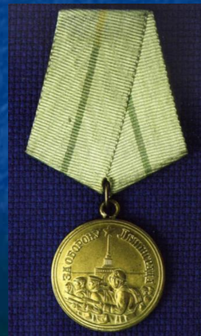
Медаль «За оборону Ленинграда»