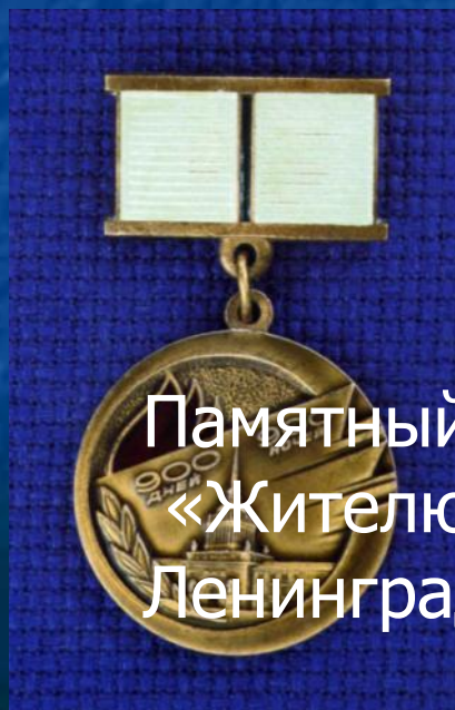
Памятный знак «Жителю блокадного Ленинграда»