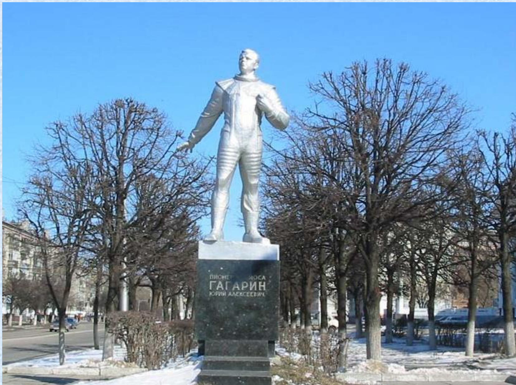
Поставлен памятник первому космонавту Юрию Гагарину.