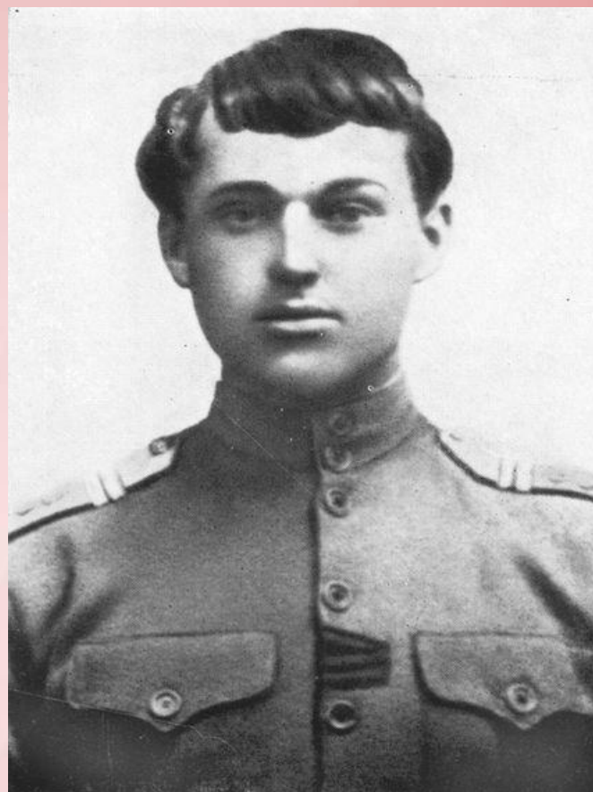
Драгун К. Рокоссовский. 1926 год.

«С самого раннего детства меня увлекали книги о войне, военных походах, битвах, смелых кавалерийских атаках... Моей мечтой было испытать все, о чем говорилось в книгах, самому»