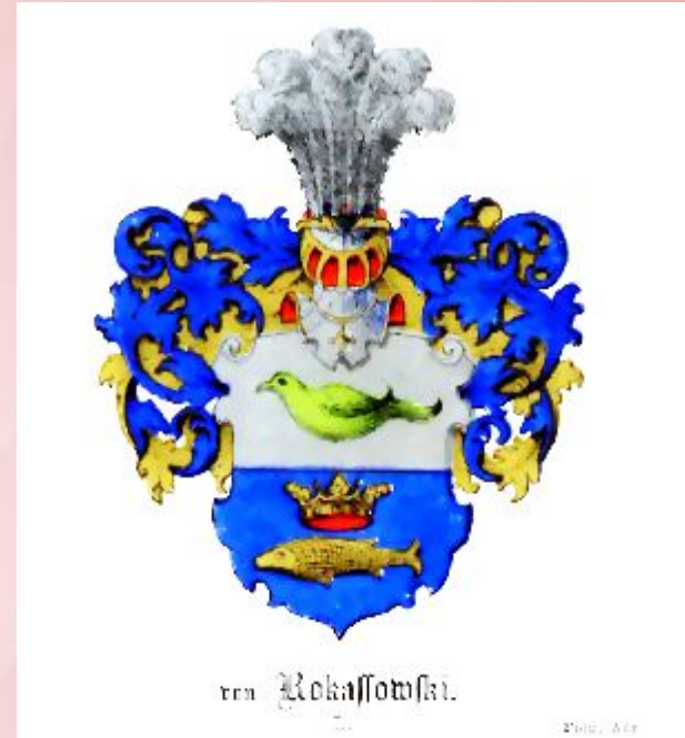
Герб рода Рокоссовских