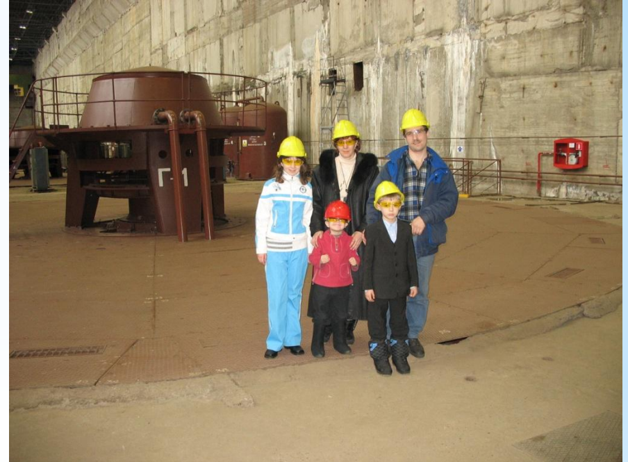
Мы на экскурсии по Шульбинской ГЭС