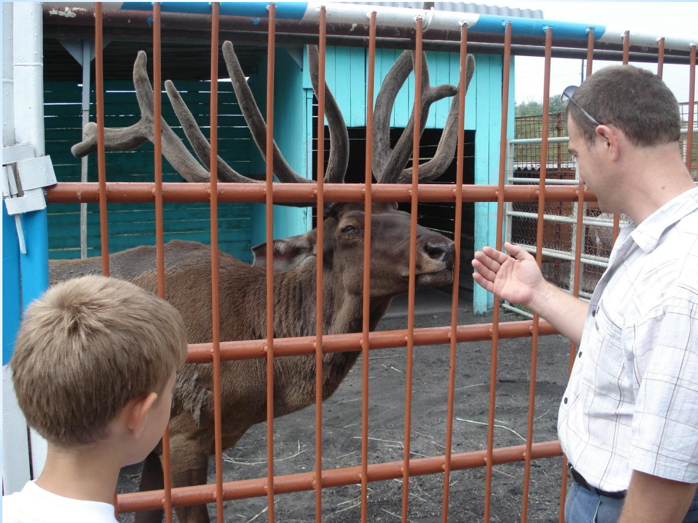
Мы в зоопарке