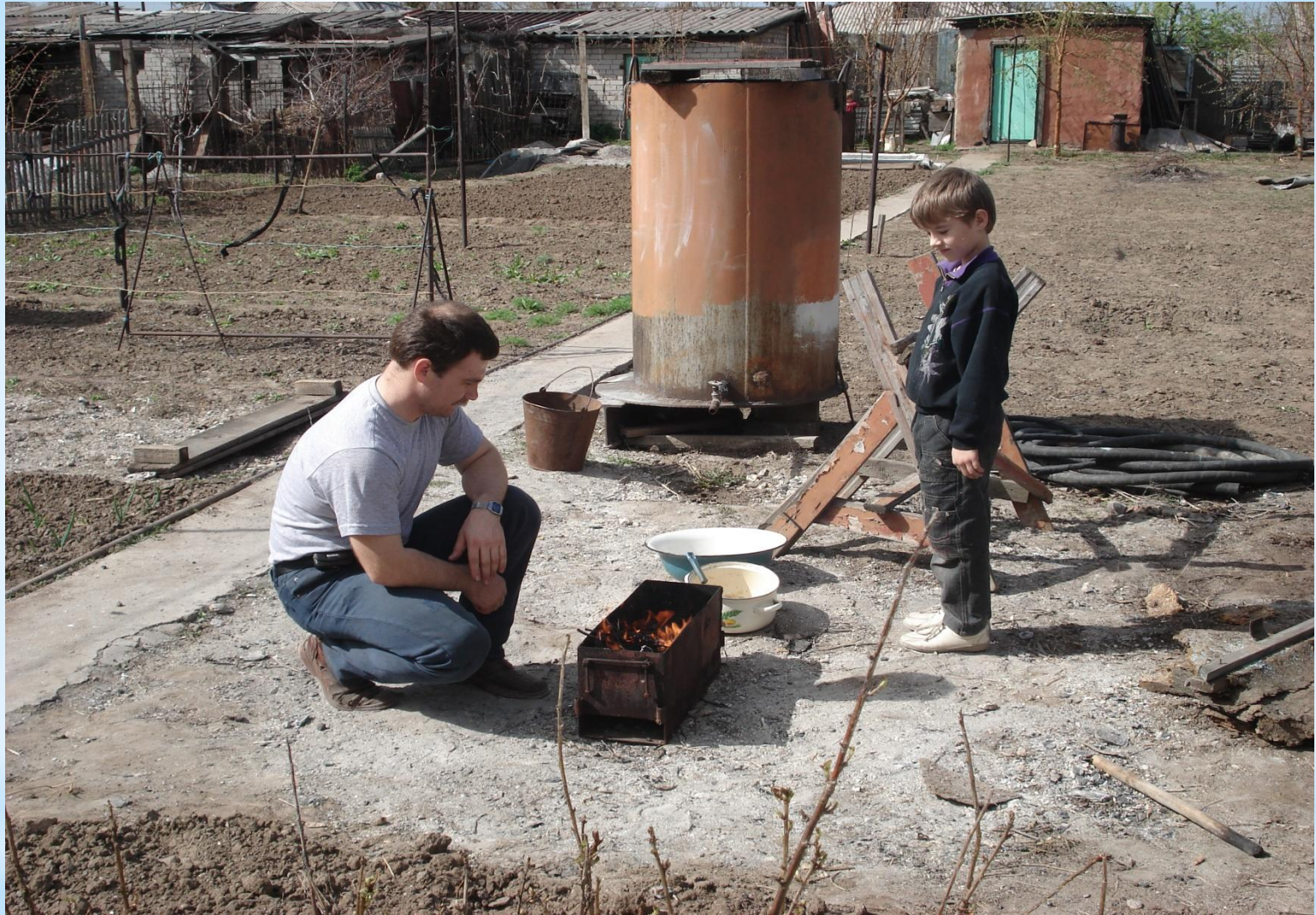
Мы на шашлыках