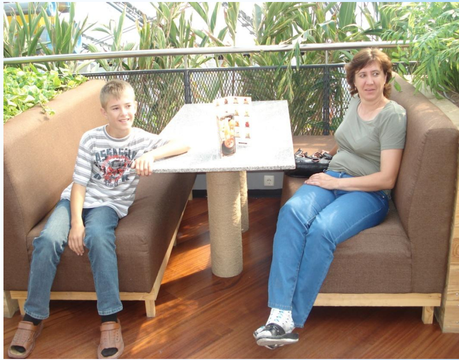
Мы в Астане