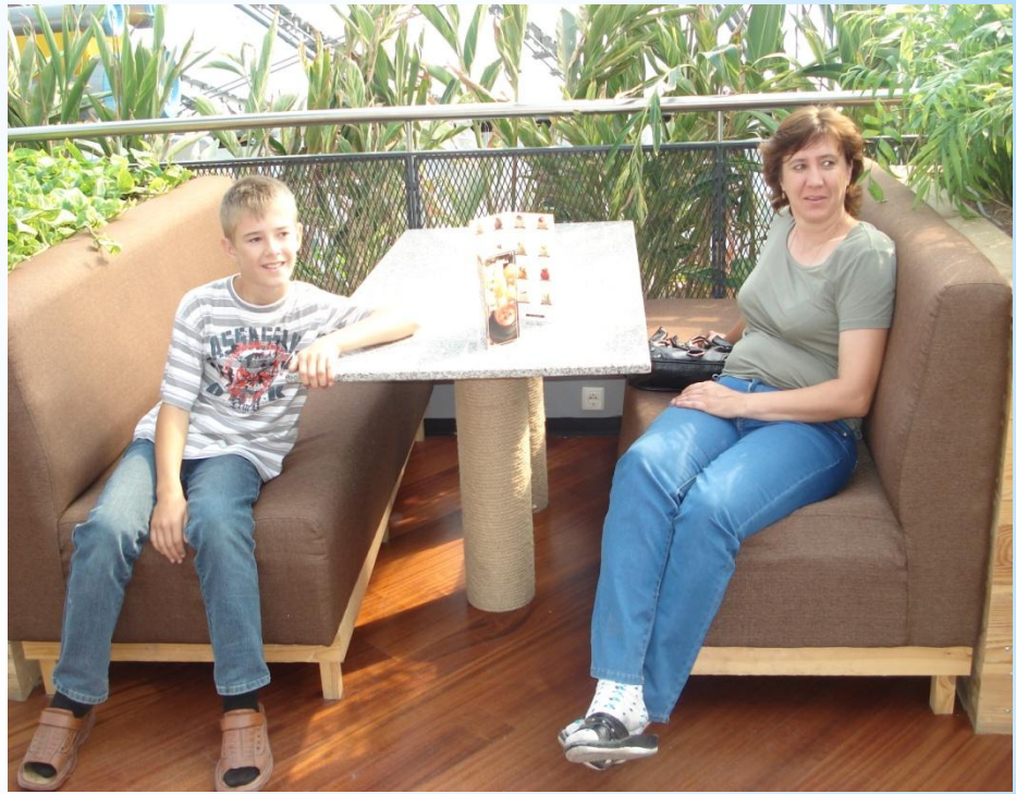
Мы в Астане