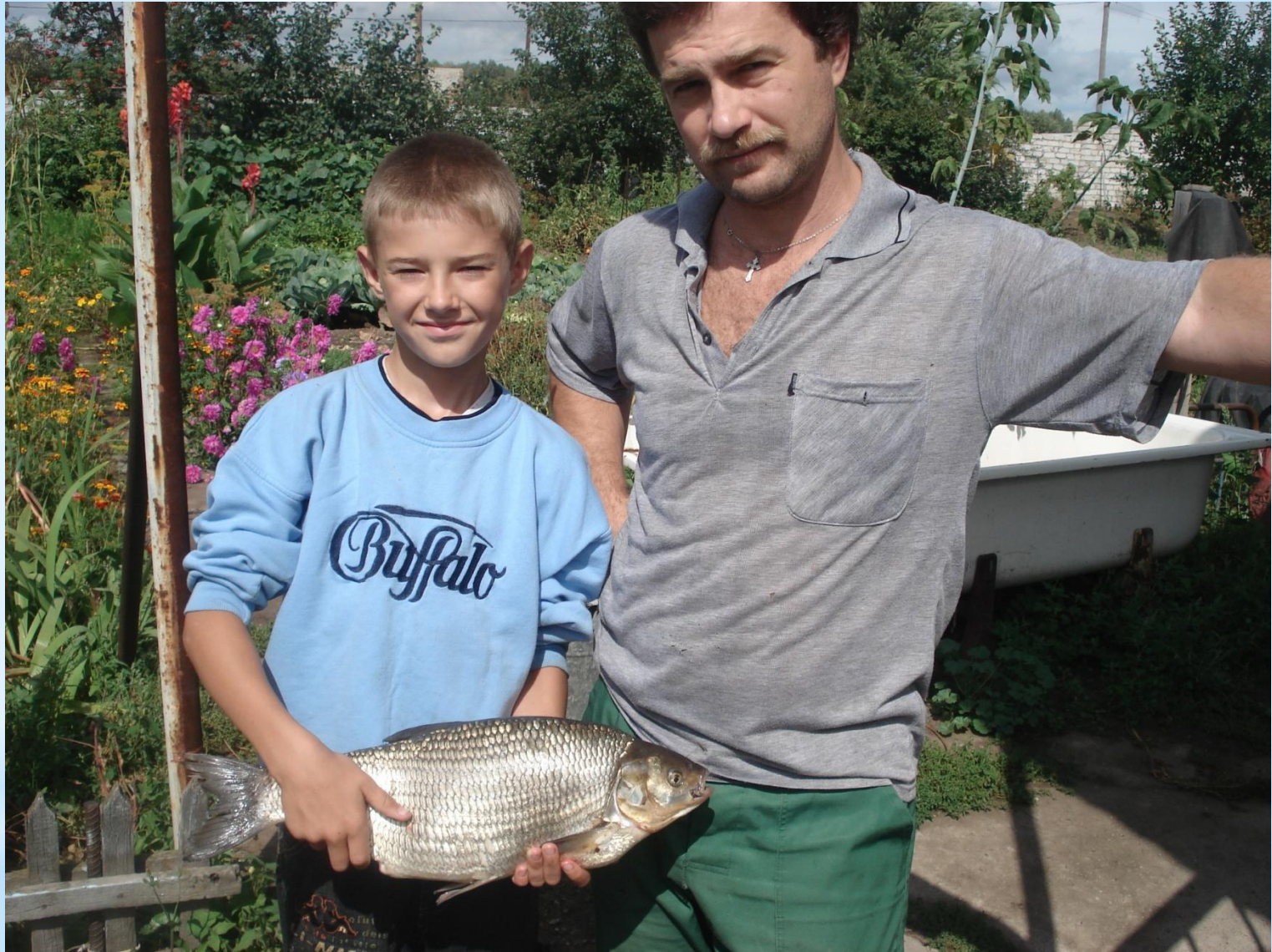
Мы после рыбалки