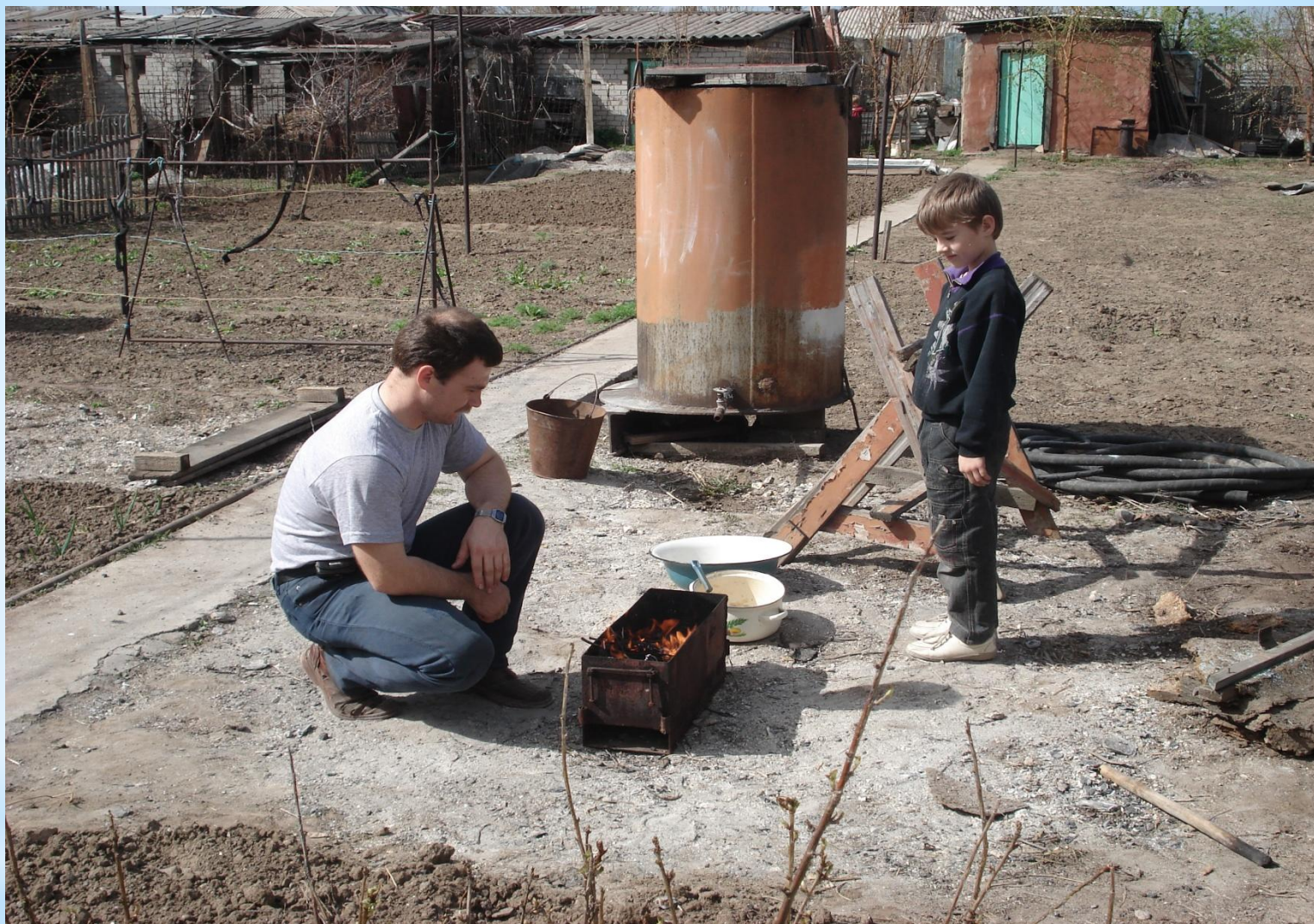
Мы на шашлыках