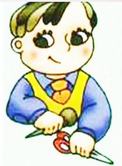
Правила поведения при работе с ножницами