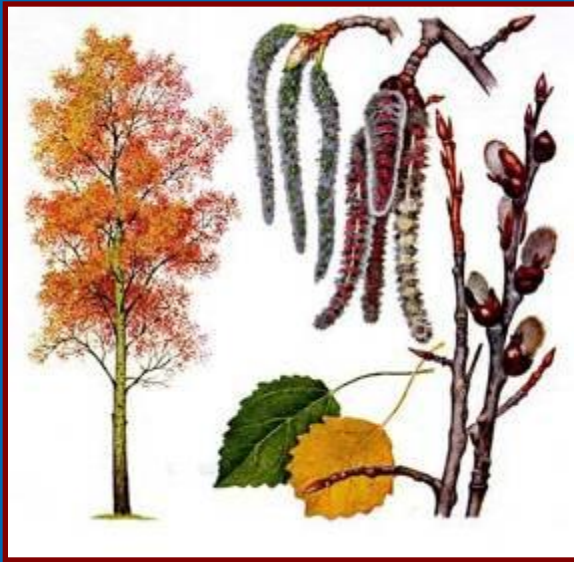
60 - 80 ИЙ