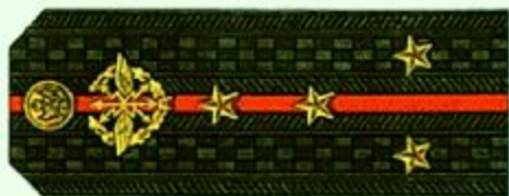
Капитан (повседневная форма одежды)