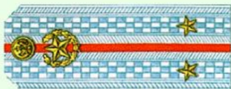
Лейтенант (парадная форма одежды)