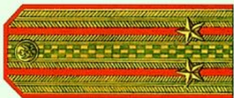
Подполковник (парадная форма одежды)