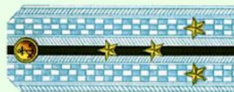
Капитан-лейтенант (парадная форма одежды, ВМФ)