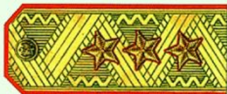
Генерал-полковник (парадная форма одежды)