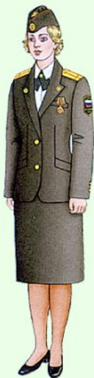
Летняя парадная для строя и вне строя (кроме ВМФ)