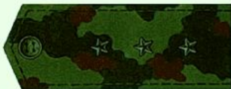
Старший прапорщик (полевая форма одежды)