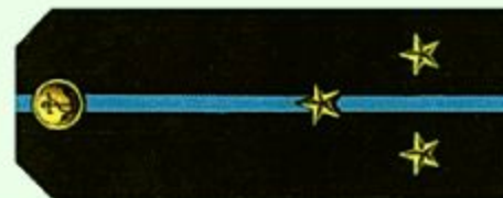
Старший лейтенант (повседневная форма одежды, морская авиация)