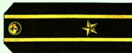
Капитан 3 ранга (повседневная форма одежды)