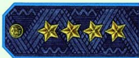
Генерал армии (парадная форма одежды, ВВС)