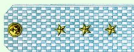
Старший мичман (парадная форма одежды, ВМФ)