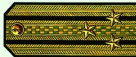
Капитан 1 ранга (парадная форма одежды)