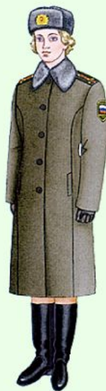
Зимняя повседневная вне строя (кроме ВМФ)