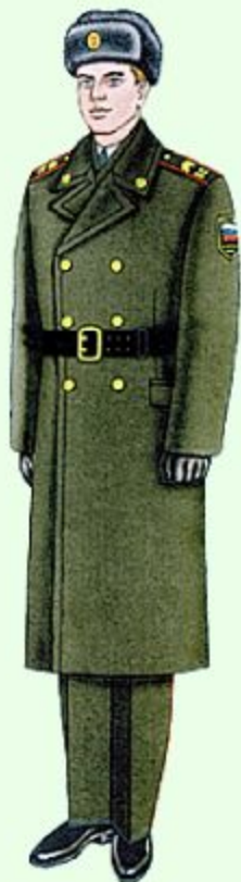
Парадная для строя