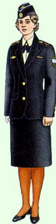
Летняя повседневная вне строя в ВМФ