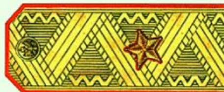
Генерал-майор (парадная форма одежды)