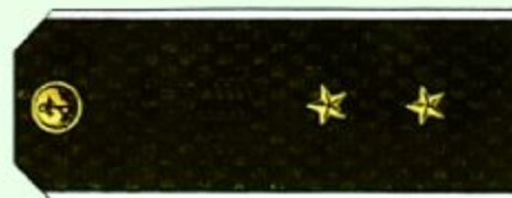
Мичман (повседневная форма одежды, ВМФ)