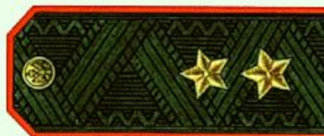
Генерал-лейтенант (повседневная форма одежды)