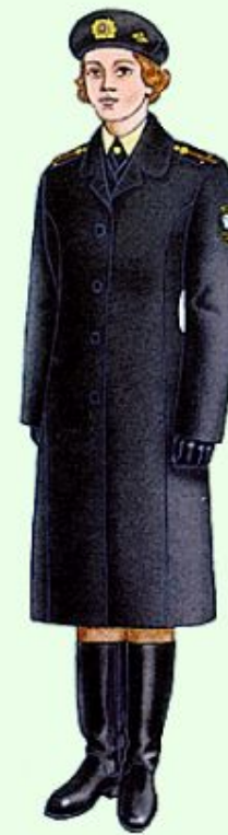
Зимняя повседневная вне строя в береговых войсках ВМФ