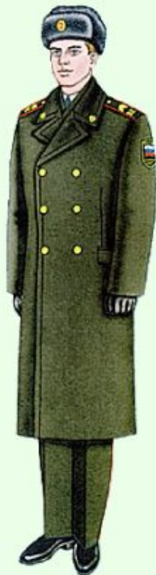
Парадная вне строя