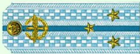
Старший лейтенант (парадная форма одежды, ВВС)