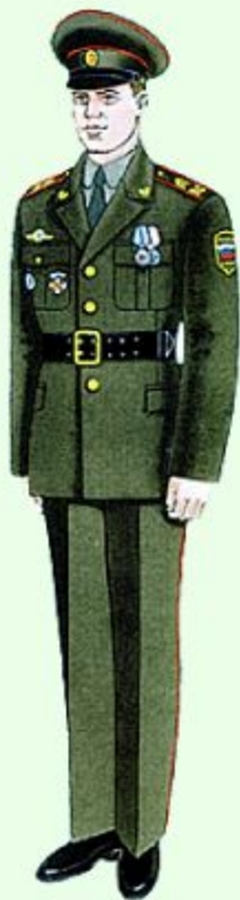
Парадная для строя