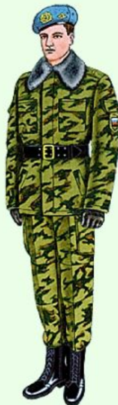
Парадная для строя в ВДВ