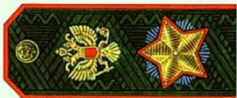
Маршал Российской Федерации (повседневная форма одежды)