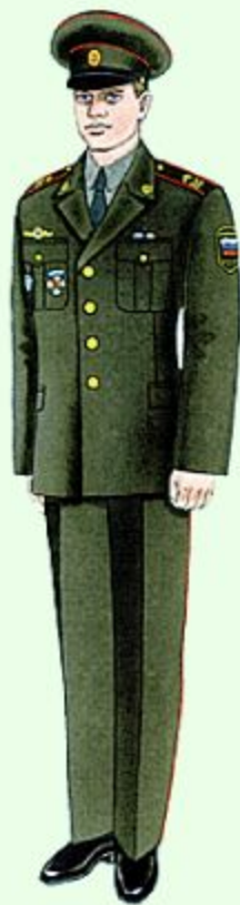
Парадная вне строя