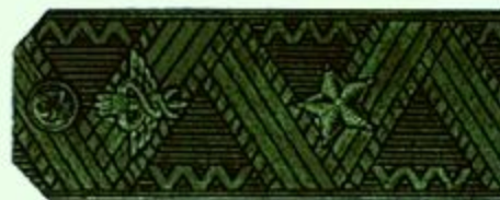
Генерал-майор (полевая форма одежды)