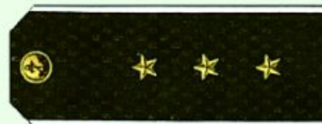
Старший мичман (повседная форма одежды, ВМФ)