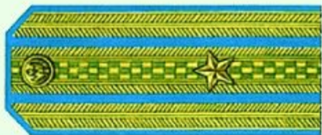
Майор (парадная форма одежды, ВВС, ВДВ)