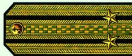
Капитан 2 ранга (парадная форма одежды)