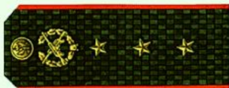
Старший прапорщик (повседневная форма одежды)