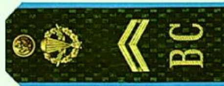
Младший сержант (ВДВ)