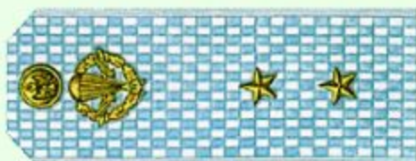
Прапорщик (парадная форма одежды, ВДВ)