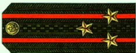
Полковник (повседневная форма одежды)