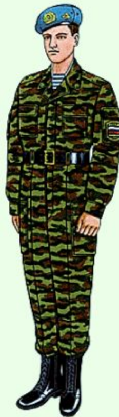
Парадная для строя и вне строя в ВДВ