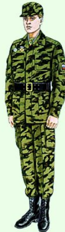
Повседневная для строя и вне строя