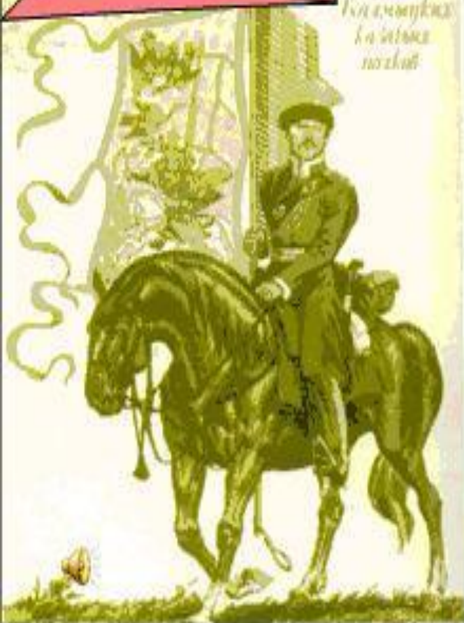
Участник Отечественной войны калмык