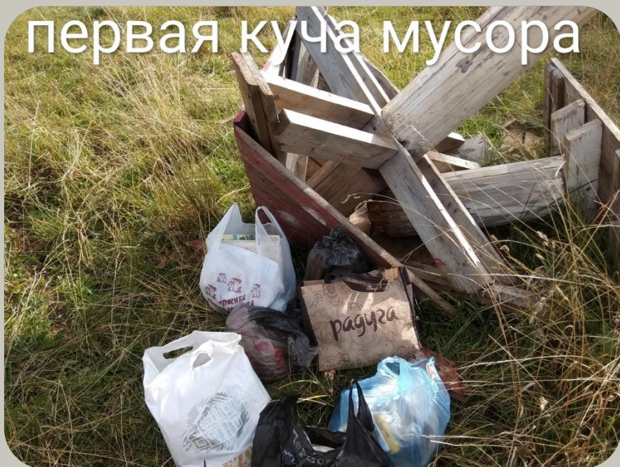
куча в центре деревни