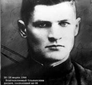
26-28 марта 1944 Полтавский Огненный декаль, основанный на 88 дней работы...