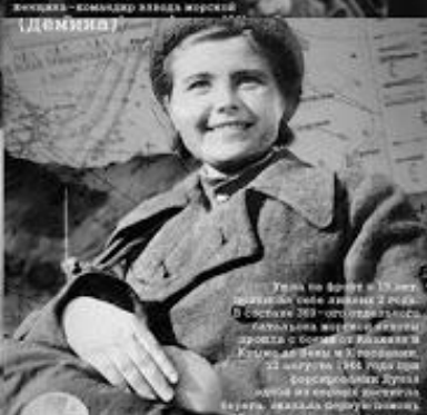
Узнав во время плену с 18 января захватил пленными 100 и расстрелял