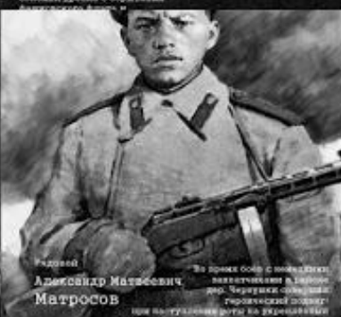
Матросов Александр Матросов

Во время боя с немцами защитил командир в плену лето. Чернышевский Героический солдат при подступах к речке участник боёв с немцами Кавказскими войсками