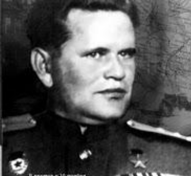
В плену с 18 января