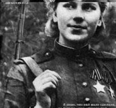
Я знаю, что еще много сделано, но больше, чем обманываю вас

11 января 1942 года захватил пленными 100 и расстрелял