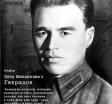
Майор Петр Михайлович Гаврилов