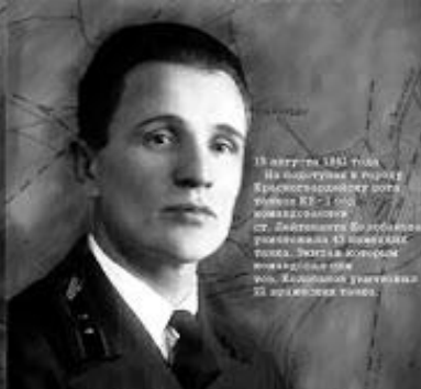
13 августа 1941 года на подступах к городу Краснодарскому юнкера УИ - 1100 командирован ст. Лабинском. Во время учениями 43 танковых танка. Загнана в оборону командиром 60 вои. Лабинская танковая 32 артиллерийского.