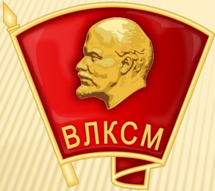
КОМСОМОЛЬСКИЙ НАГРУДНЫЙ ЗНАЧОК

Я — Комсомол! Я — Комсомол! На юной груди — значок огневой. Счастье своё в борьбе я нашёл: Рождённому бурей лишь в буре покой!