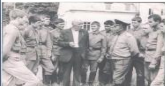
Сталовский Ф.И. на встрече с молодыми бойцами пограничной заставы в Гурьеве - 28 мая 1975 г.

В мирное время до конца своей жизни занимался патриотическим воспитанием подрастающего поколения. Он был почётным гражданином Озёрского района, частым гостем школ и военных частей расположенных на территории Озёрского района.