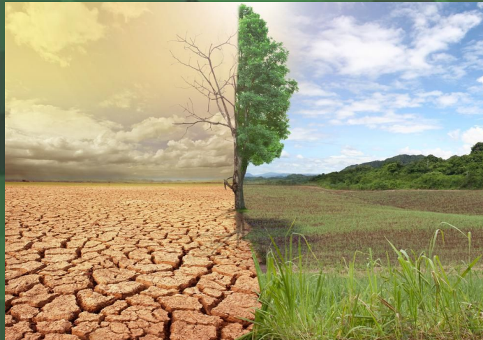
Истощение озонового слоя