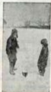
8. Петрищевские ребята около могилы, оставленной от немцами.