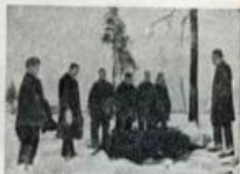
5. Пешеходы в лесу, в Петрищеве.