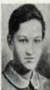
Герой Советского Союза Зоя Анатольевна Космодемьянская.

Так шли они по земле, утыканной виселицами, залитой кровью и вопившей о мщении.