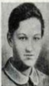
Герой Советского Союза Зоя Анатольевна Космодемьянская.

Так шли они по земле, утыканной виселицами, залитой кровью и вопившей о мщении.