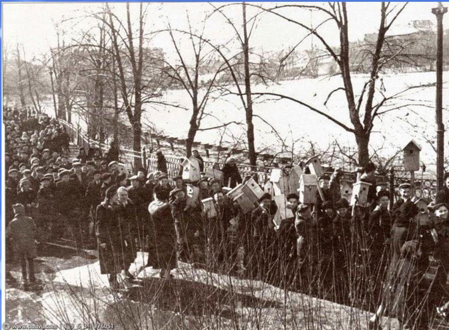
Московский зоопарк. Шествие со скворечниками в «День птиц» 1954 года.