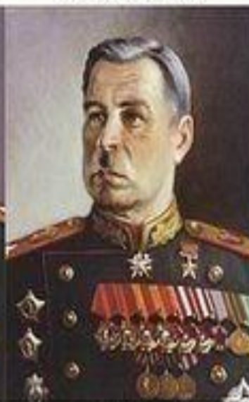
Маршал Л. А. Говоров