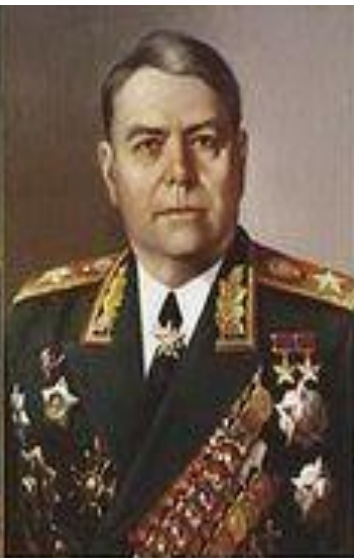
Маршал А. М. Василевский