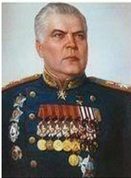
Маршал Р. Я. Малиновский