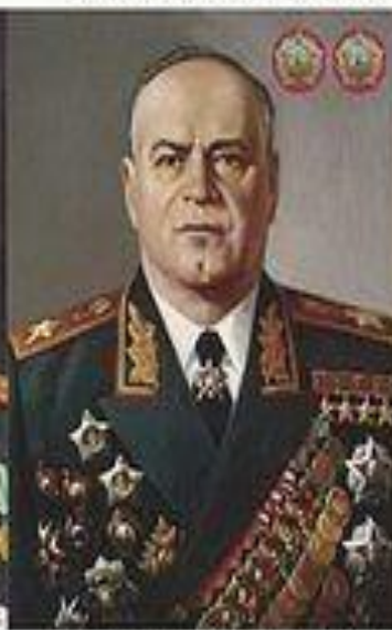
Маршал Г. К. Жуков