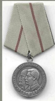
медаль "Партизану Отечественной войны" 2 степени