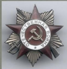
орденом Отечественной войны 1 степени