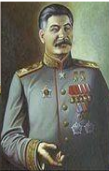
Генералиссимус И. В. Сталин