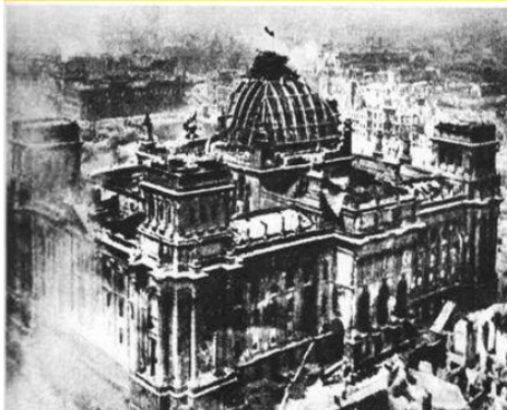
1945 г. Берлин. Поверженный рейхстаг