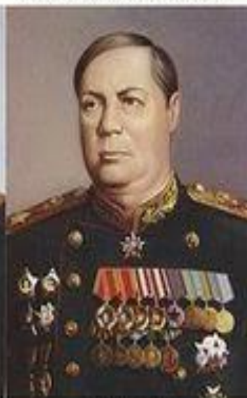
Маршал Ф. И. Толбухин