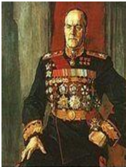
Маршал Г. К. Жуков