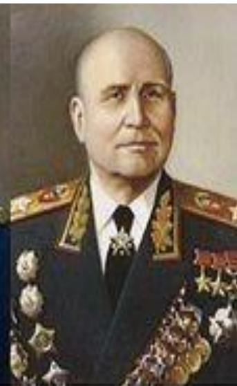
Маршал И. С. Конев