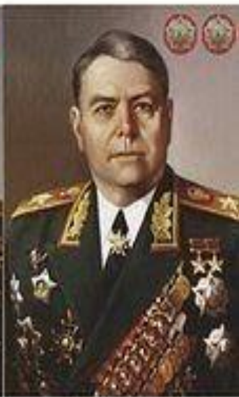
Маршал А. М. Василевский