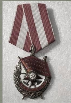
орден красного знамени