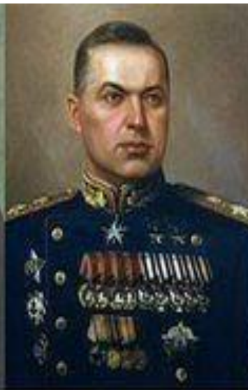
Маршал К. К. Рокоссовский