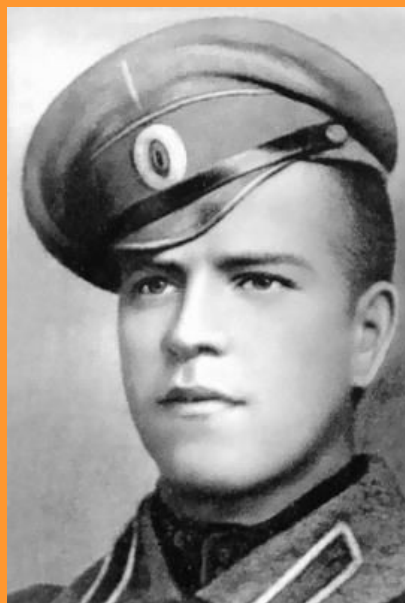
Георгий Жуков в юности

Георгий всегда был парнем не робкого десятка. Однажды на танцах разгорелась ссора из-за девушки. Кто-то выхватил револьвер, угрожая будущему маршалу. Жуков отобрал оружие и, забросив его в кусты, спокойно продолжал танцевать. Георгий и не предполагал, что в будущем ему не раз придется демонстрировать хладнокровие и решительность. Когда началась Первая мировая война, в 1915 году его призвали в армию и зачислили в кавалерийский полк. Первая война - первые награды. Жуков получил два Георгиевских креста - за взятие в плен немецкого офицера и за контузию во время конной разведки.