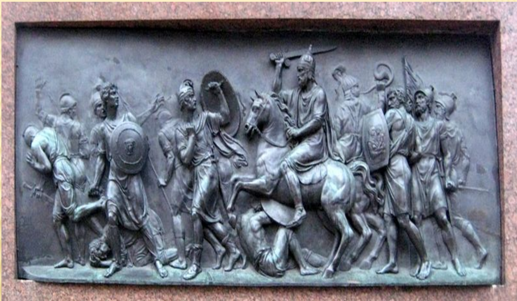
ГОРЕЛЬЕФ С ПАМЯТНИКА МИНИНУ И ПОЖАРСКОМУ