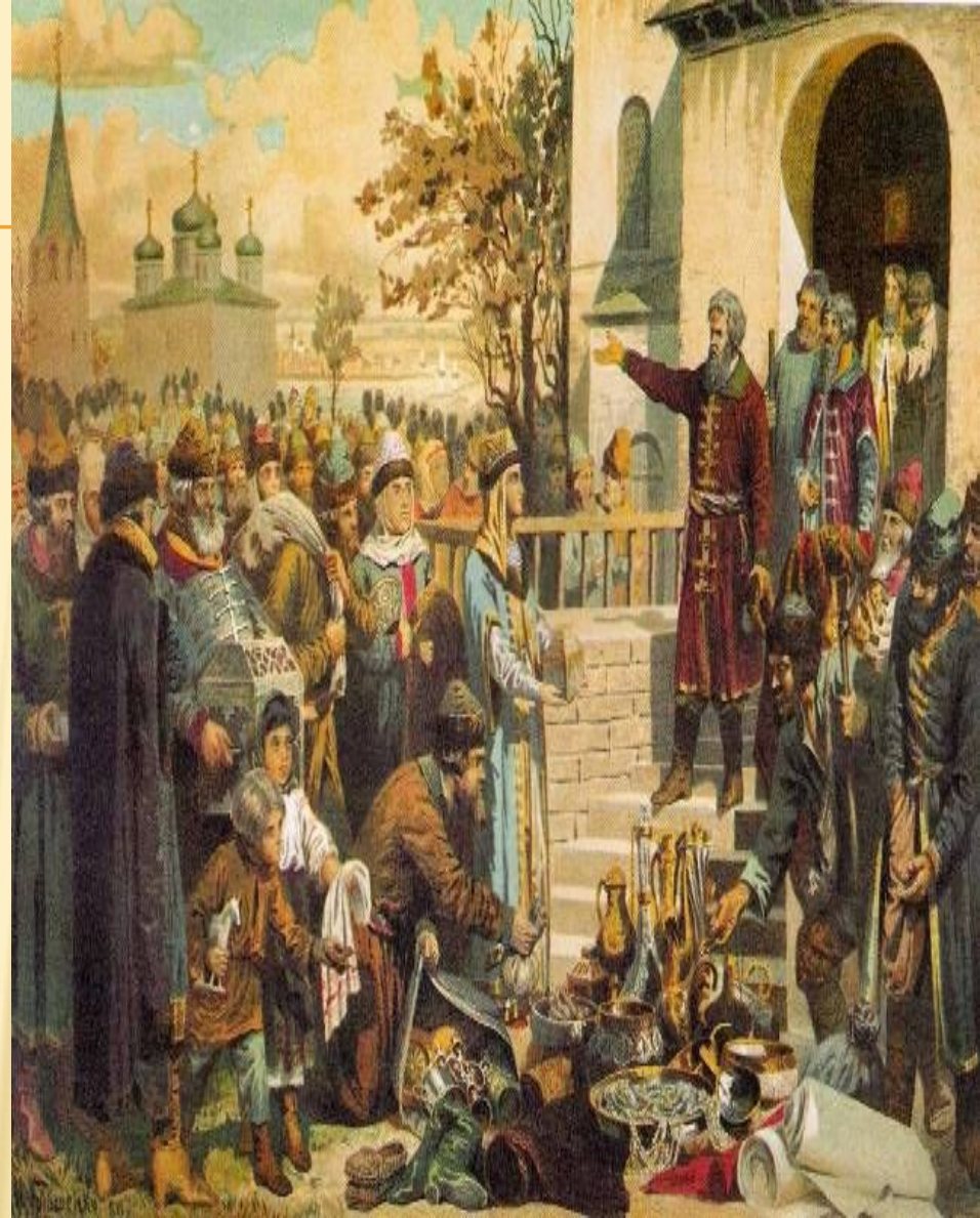
А.Кившенко «Воззвание Минина»

Принялся Козьма Минин собирать силы и средства на освобождение Отечества. Поняли нижегородцы, что все они крепко-накрепко связаны единою бедой, единою надеждой. Собрались они на площади и всё, что скопили за жизнь, полную лишений, стали отдавать на ополчение.